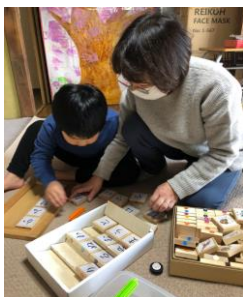
ポーターシ個別療育