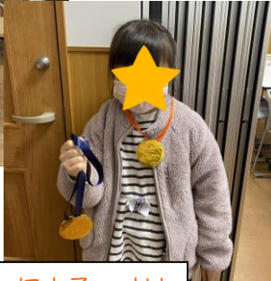
☆豆ちゃんリーダーによる、オリンピッククイズと金メダル作り☆