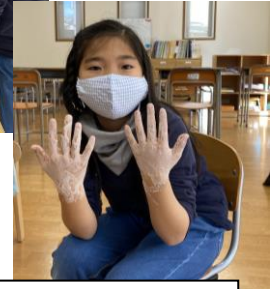
☆ひろっちリーダーによる、手洗い実験☆